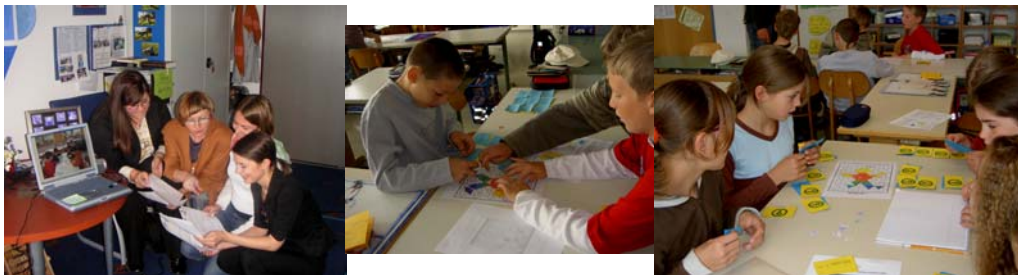
PEG 2005- a multi-dimensional game of learning process

Wir eignen uns sinnvoll Kenntnisse an, wenn es in verschiedenen Kontexten geschieht und wenn wir versuchen, diese dann multidimensional zu nutzen. Die Vernetzung von theoretischem und alltagspraktischem Lernen ist im Lebensspiel selbst intendiert. Deshalb entwickelten wir PEG - ein Bildungsspiel, welches auf dem Spielbrett einen Menschen bzw. ein Kind in allen wichtigen Lebensdimensionen simuliert. Mit PEG spielerisch zu lernen fördert das Denken, Fühlen und die Kreativität ebenso wie soziale Erfahrungen; es vermittelt auch Freude beim Lernen durch Lehren. Diese moderne Bildungsstrategie wollen wir an verschiedenen Spielversionen zu PEG bei dieser internationalen Zusammenkunft vermitteln.